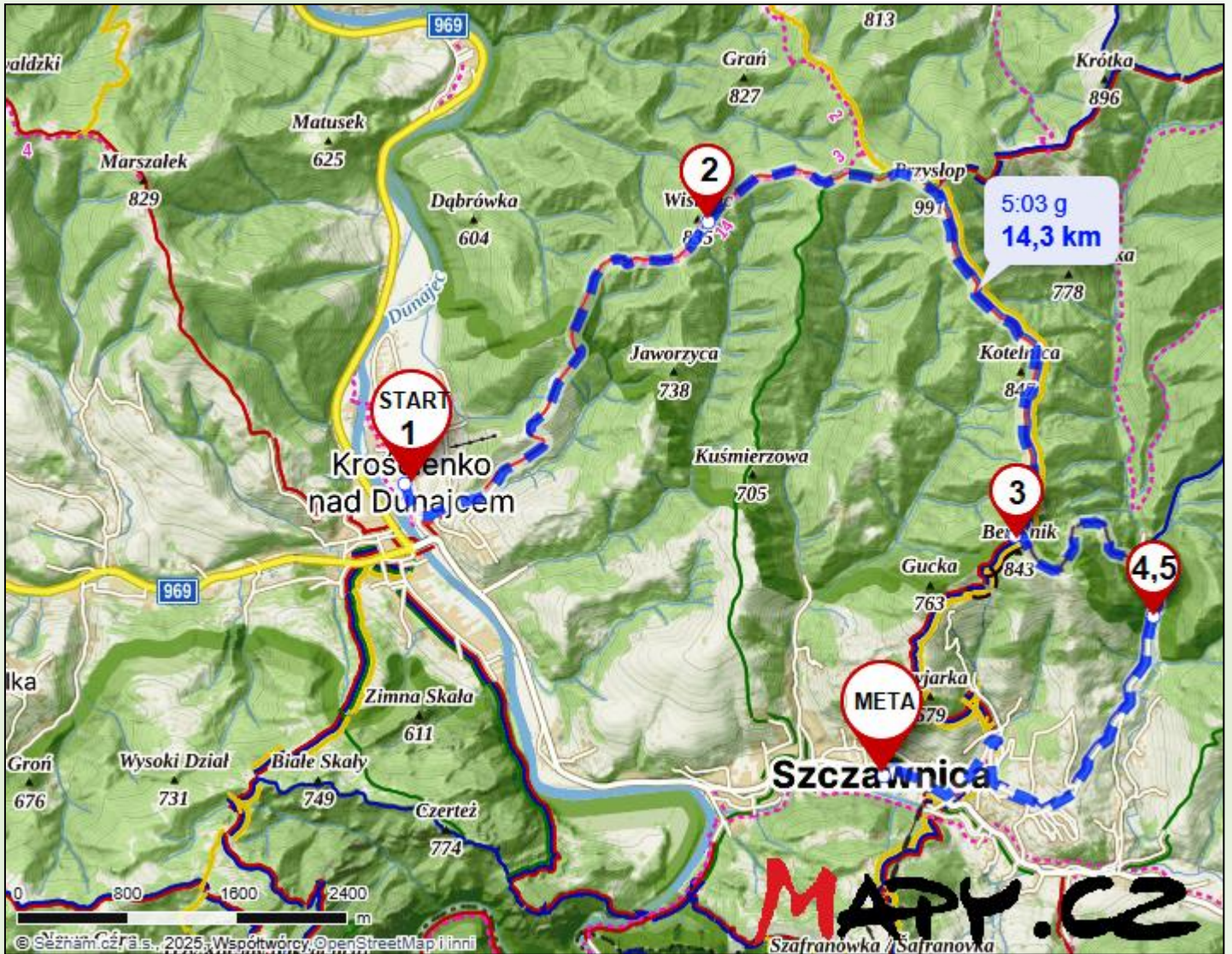
Mapa trasy wykonana w ramach bezpłatnej licencji portalu www.mapy.cz