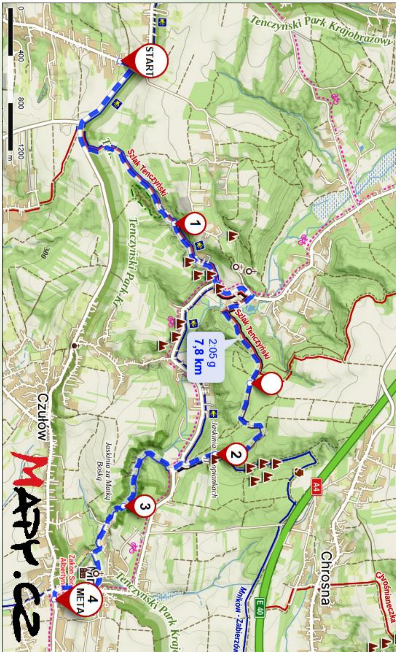
Mapa trasy wykonana w ramach bezpłatnej licencji portalu www.mapy.cz